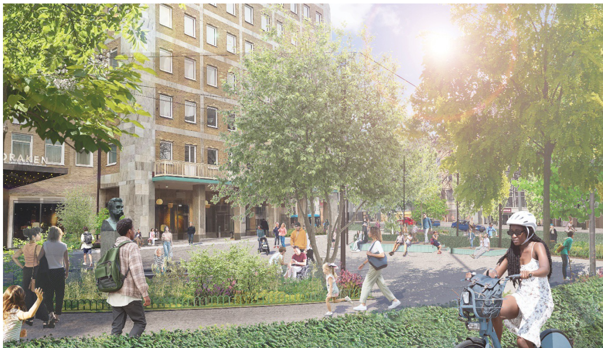
Visionsbild Olof Palmes plats.

I januari, efter julhelgerna, startar arbetet med att rusta upp Olof Palmes plats till en lummig och inbjudande del av området med nya träd, planteringar, sittplatser och belysning. Arbetet kommer pågå i olika etapper och planeras i sin helhet bli klart sommaren 2025. Inför byggnationen har en del förberedande arbeten pågått på platsen och träd som varit sjuka har tagits ned.